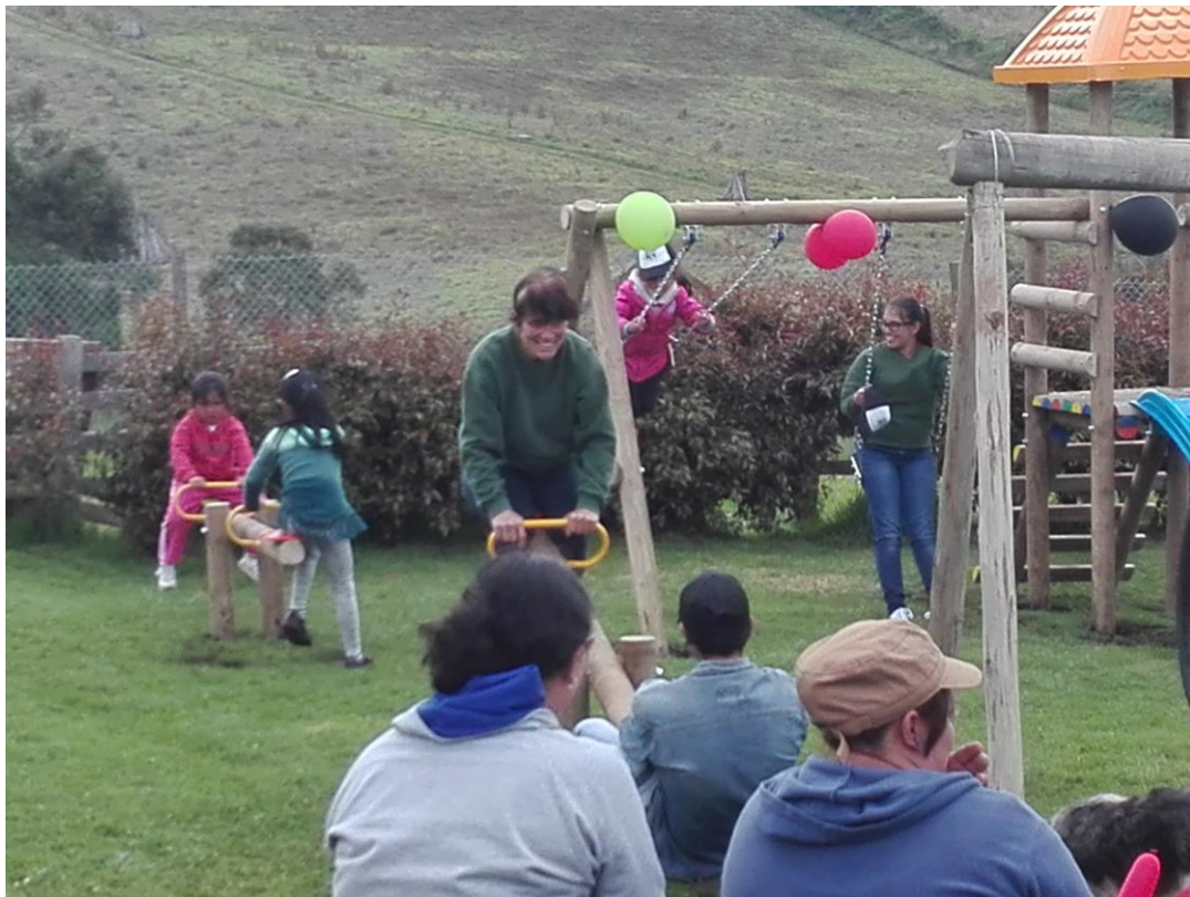
Das macht auch mit 50 noch Spass: Die „profe“ muss es jetzt auch ausprobieren!